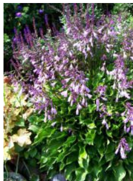
Hosta 'Harry van Trier'