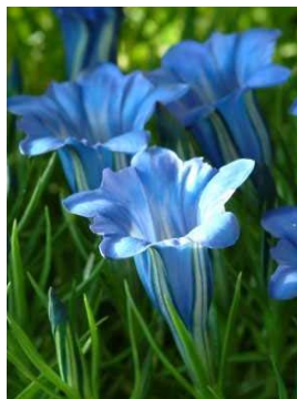
Gentiana 'Compact Gem'